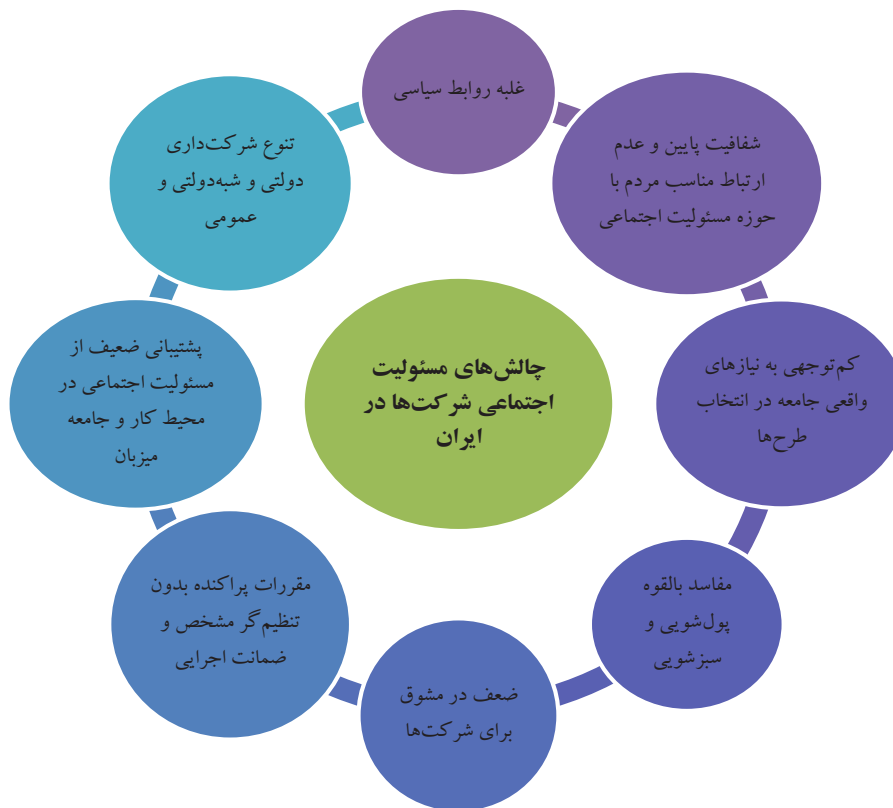
شکل ۱. چالش‌های مسئولیت اجتماعی شرکت‌ها در ایران