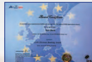
دریافت نشان از کنفرانس استقامت ملی از سوی مرجع بین المللی ACS (متخصص در ارائه انواع خدمات ایزو) سال ۲۰۱۶