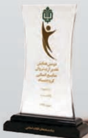
کسب رتبه سوم در دومین همایش تقدیر از پیشروان منابع انسانی گروه بنیاد مستضعفان اسفند ۹۷