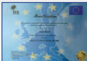
دریافت نشان از کنفرانس آیتک حامی آسایش مشتریان جایزه SCC در بانکداری ۲۰۱۷