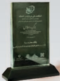
کسب نشان عالی روابط عمومی خلاق و دانش محور در پانزدهمین اجلاس مدیران معتبر شرکت های عالی ایرانی سال ۱۳۹۵