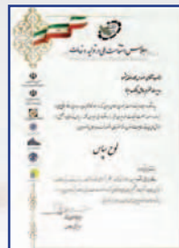
کسب لوح تقدیر در اجلاس استقامت ملی در تولید و خدمات به بانک سال ۱۳۹۷