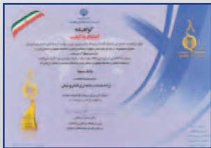
دریافت گواهینامه جایزه ملی کیفیت ارتباطات و فناوری اطلاعات اسفند ۱۳۹۳