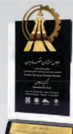
اعطای نشان برترین اعتماد، صداقت و امانت داری در صنعت بانکداری به بانک تیر ۱۳۹۶