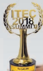
نشان زرین شهرت و اعتبار در ارائه خدمات نوین بانکی به بانک سال ۱۳۹۶