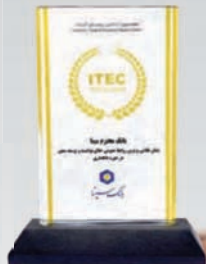
دریافت نشان طلایی برترین روابط عمومی خلاق، توانمند و توسعه محور در حوزه بانکداری