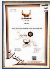
تقدیر از بانک سینا در هفتمین دوره جایزه مدیریت ملی مدیریت مالی ایران اسفند ۱۳۹۵