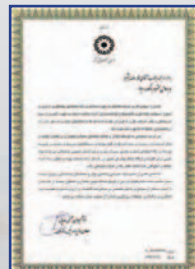
قدردانی رئیس سازمان بهزیستی کشور از بانک مرداد ۱۳۹۷