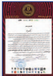
کسب عنوان کسب و کار پیشرو در پیاده سازی استراتژی اقتصاد مقاومتی آذر ۱۳۹۸