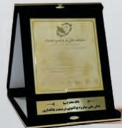
کسب نشان ملی مبارزه با پولشویی در صنعت بانکداری در پانزدهمین اجلاس سران و مدیران معتبر شرکت و سازمان های عالی رتبه ایرانی اسفند ۱۳۹۵