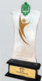
کسب رتبه اول در سومین همایش تقدیر از پیشروان منابع انسانی بنیاد مستضعفان اسفند ۱۳۹۸