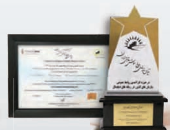
کسب رتبه برتر تاثیر گذاری بلوغ رسانه های دیجیتال دی ۱۳۹۹