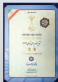
دریافت تقدیر نامه تعالی در دومین دوره جایزه ملی تعالی و پیشرفت اردیبهشت ۱۳۹۷