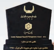
دریافت تقدیر نامه دو ستاره در هفتمین دوره جایزه ملی مدیریت مالی ایران سال ۱۳۹۵