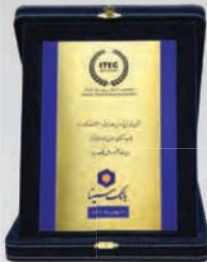
کسب لوح تقدیر نشان ملی نبوغ و مدیریت ایرانی در صنعت بانکداری در هشتمین اجلاس رؤسای آیتک بهمن ۱۳۹۶