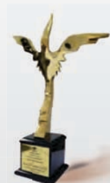
انتخاب واحد برگزیده در همایش تولید برتر، خدمات برتر و گسترش صادرات شهریور ۱۳۹۵