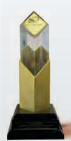
دریافت نشان زرین استقامت ملی در ارائه برترین خدمات بانکی اسفند ۱۳۹۵