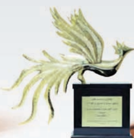
دریافت لوح تقدیر و تندیس صنعت برتر در تحقق سند چشم انداز افق ۱۴۰۴ تیر ۱۳۹۵