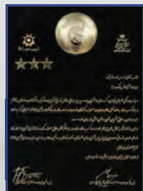
دریافت نشان رضایتمندی مشتری بهمن ۱۳۹۴