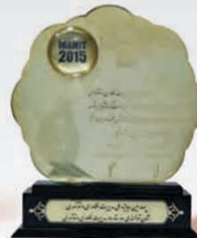
دریافت نشان توانمندی در چهارمین دوره جایزه ملی مدیریت فن آوری و نوآوری خرداد ۱۳۹۵