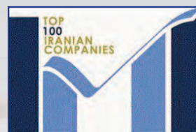
ارتقاء ۷ پله ای برای نهمین سال متوالی در میان یکصد شرکت برتر ایران بهمن ۱۳۹۰