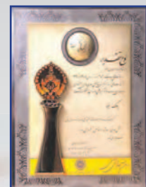
کسب رتبه برتر جشنواره ملی بهره‌وری اسفند ۱۳۹۱