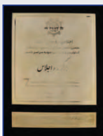
اهداء نشان عالی مدیریت سرآمد در صنعت بانکداری به مدیر عامل بانک مرداد ۱۳۹۵